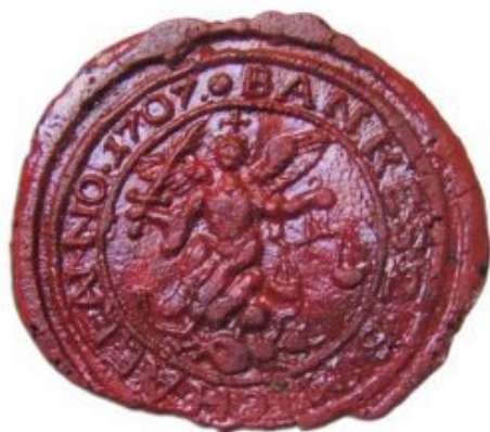
Pečať obce Bánov (história)