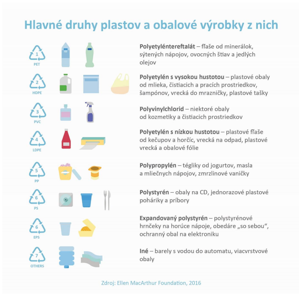
Obr. 2:

stopu“. Počas jedného roka tak dôkladne odkladal každý kúsok plastového odpadu, až nazbieral neuveriteľných 4 490 položiek!