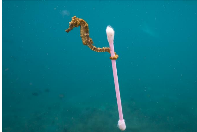
Obr. 5: ZDROJ: www.dpreview.com

Takmer polovicu odpadov, ktoré sa povalujú na európskych plážach, tvoria plasty na jedno použitie. Ide najmä o vatové tyčinky, plastový riad, nádoby na potraviny, plastové poháre a vrchnáky, plastové fľaše, vrecúška a ďalšie jednorazové obaly, ktoré spolu s rybárskym výstrojom tvoria až 70 % odpadu na morskom pobreží v Európe.