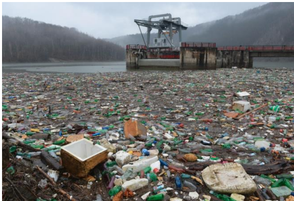
Čistenie vodnej nádrže Ružín od naplaveného odpadu

Na to, aby sme videli skutočný ostrov plastov , nemusíme vôbec cestovať k moru. Takýto ostrov máme každoročne aj na slovenskej rieke Bodva alebo vodnej nádrži Ružín . Vždy, keď sa zdvihne hladina vody, rieka začne splavovať všetok plastový odpad rozhádzaný po jej brehoch.