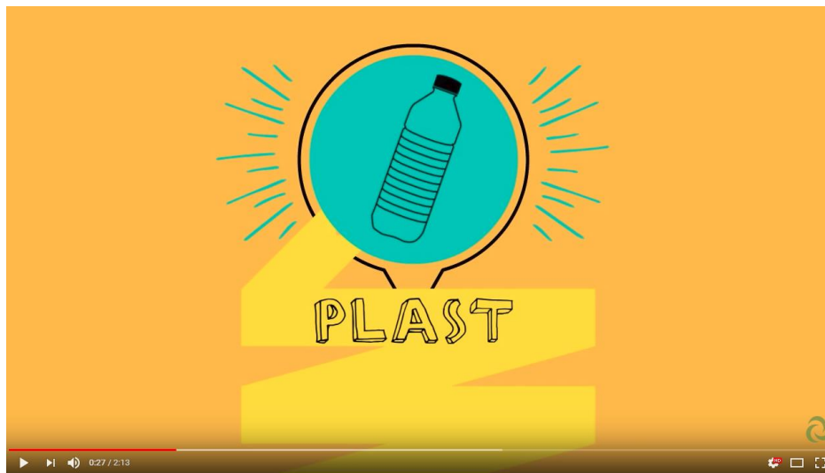
Obr. 3: Pozrite si video k téme plasty , ktoré je súčasťou seriálu „Nehádzme všetko do jedného vreca“. Video nájdete na www.naturpack.sk v sekcii Verejnosť v podsekcii Vzdelávanie .

Najdôležitejším článkom v recyklácii odpadu si práve TY! Triedením odpadu môžeme pomôcť nielen sebe, ale aj našej prírode. Triedenie je predsa hračka. 😊