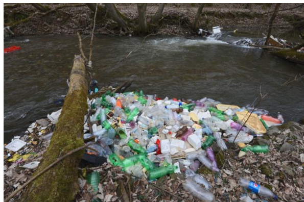
Odpad v rieke Bodva pri Jasovej